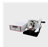
Microtomo de conge...