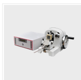
Microtomo de conge...