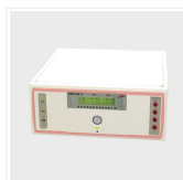
Sistema de conge...