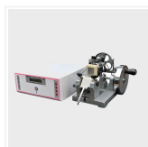
Microtomo de conge...