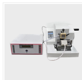
Microtomo de conge...