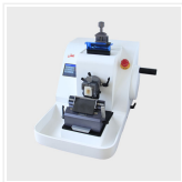
Fully Automatic Mic...