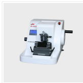
Fully Automatic Mic...